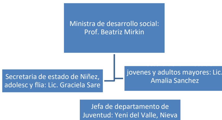
Figura N°2: Organigrama de la institución

El Equipo técnico de la Institución está constituido por cinco Trabajadoras Sociales, cuatro Psicólogos, un Abogado, un Profesor de Educación Física y dos Talleristas. Todos estos están a cargo de la Jefa de departamento de juventud. Ver en organigrama.