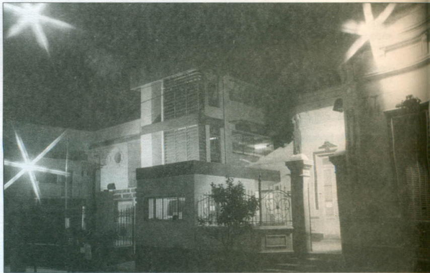
•Nuestra Casa. Hoy